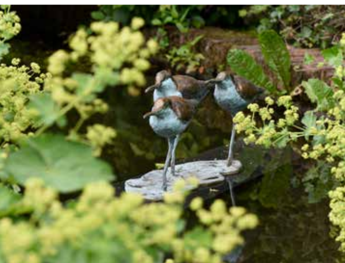
Inzetjes: Jonneke Kodde