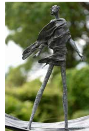
Beelden links: Anke Birnie